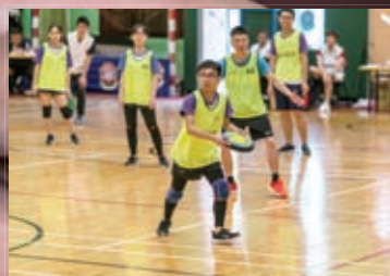
第一屆全港躲避盤公開賽(躲避盤聯會)冠軍