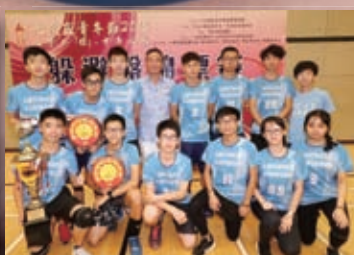
元朗區青年節躲避盤錦標比賽