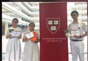
Harvard Book Prize