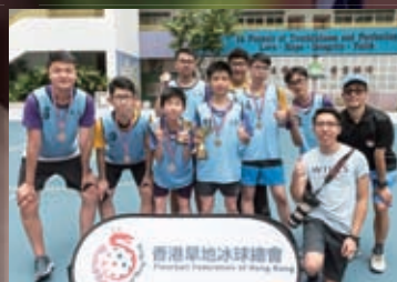
早地冰球全港學界錦標賽(中學組)