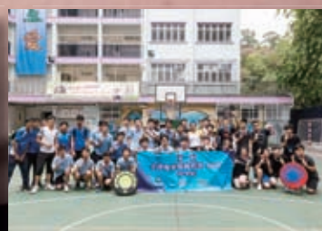
第一屆全港躲避盤錦標賽(中學組)季軍