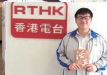
全港中學生聲演比賽2019 (普通話組)