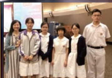
明報小作家開學禮