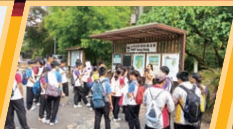
考察米埔自然保護區