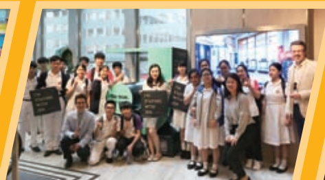
中四級旅遊與款待科參觀香港今旅酒店