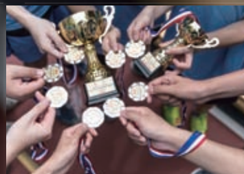
早地冰球全港學界錦標賽(中學組)