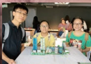
展城館暑期規劃學校課程