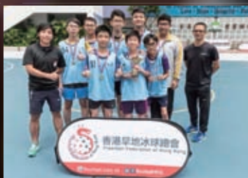
早地冰球全港學界賽