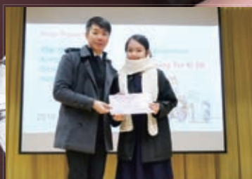
第三屆全港青少年進步獎