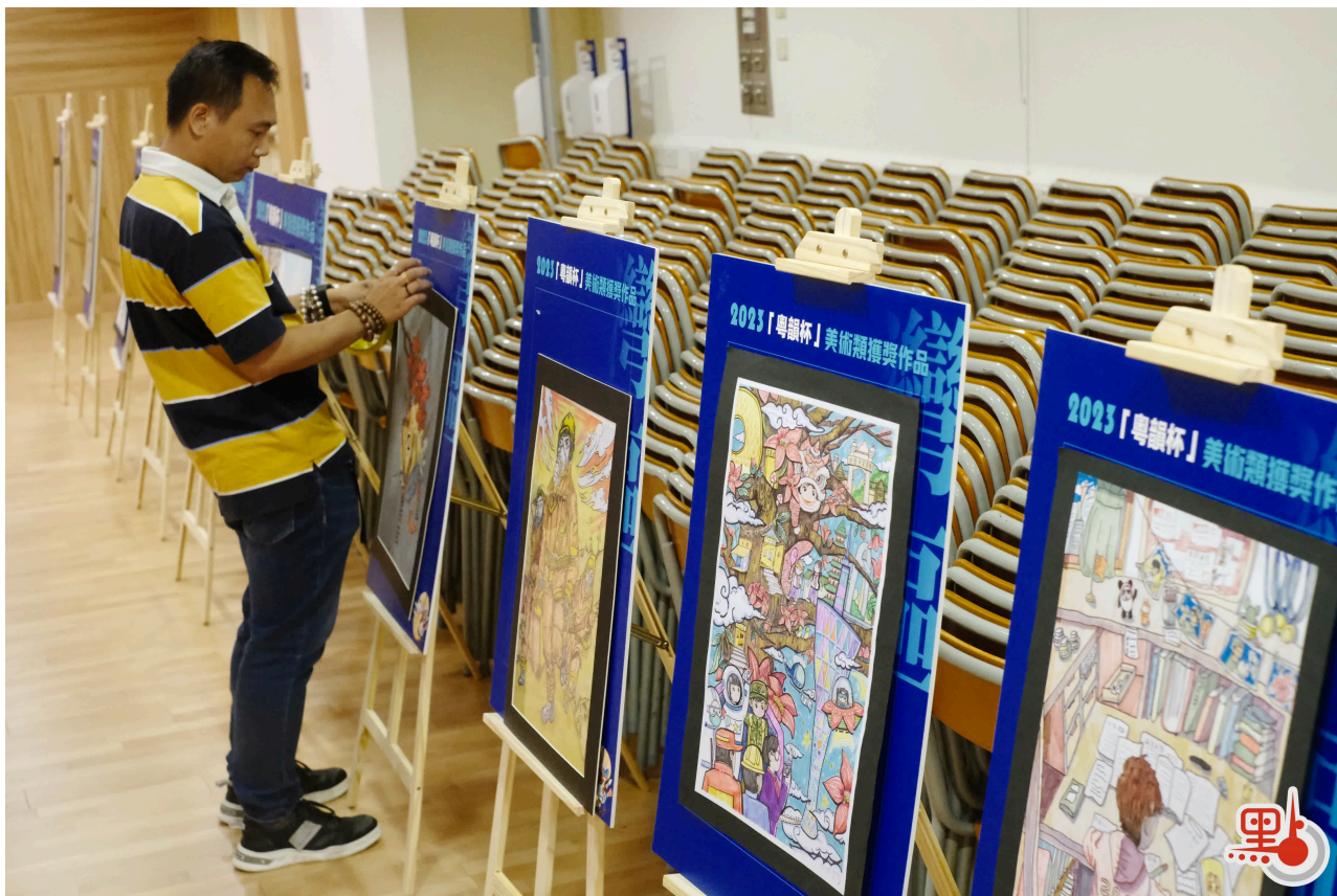
大賽即日起歡迎粵港澳三地中小學生投稿。圖為去年「粵韻盃」賽事美術類獲獎作品。

據介紹，大賽分為作文大賽與美術大賽兩大主題，今日起接受來自港澳地區在讀中小學生，以及在內地就讀的港澳籍學生投稿，其中作文賽圍繞「共閱灣區·同繪未來」，學生可選擇「灣區民俗文化」、「共讀歷史」或「共迎全運」中的一項主題進行創作。美術大賽則要求以粵港澳大灣區傳統文化、歷史文化傳承、共迎全運、科技未來、綠色生態為素材，創作出具有思想性、藝術性、創意性、時代性的作品。