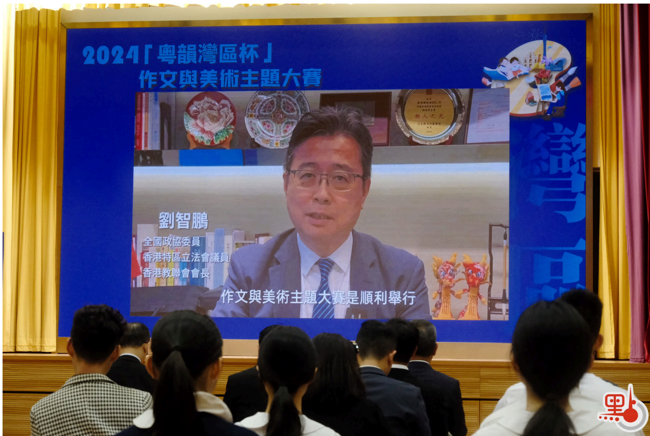
大賽邀請香港立法會議員劉智鵬等擔任特約評委。

大賽更邀請香港立法會議員何君堯、劉智鵬、陳穎欣，以及2004年奧運會跳水冠軍楊景輝擔任特約評委，以提供更多元化的視角和評價。