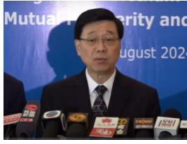
李家超結束東盟之行 共簽署55份合作協議及備忘錄 2024-08-02 18:06