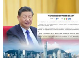
習主席回信「寧波幫」 勉勵企業家 香港商界應積極為真獻國家 2024-08-02 15:28