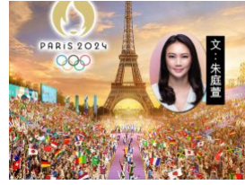
巴黎奧運讓世界對中國智造大開眼界 2024-08-02 16:35