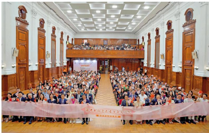
圖：參與魯青獎香港賽區頒獎禮的嘉賓和學生合影。

今年是中華人民共和國成立75周年，也是魯迅先生誕辰143周年。為紀念這一重要時刻，第15屆魯迅青少年文學獎香港賽區頒獎禮於19日，亦是魯迅先生的逝世紀念日，在香港大學陸佑堂舉行，吸引了眾多香港學校及青年學生，共同參與這一文學盛事。本次比賽收到參賽作品4563件，創歷屆之最。