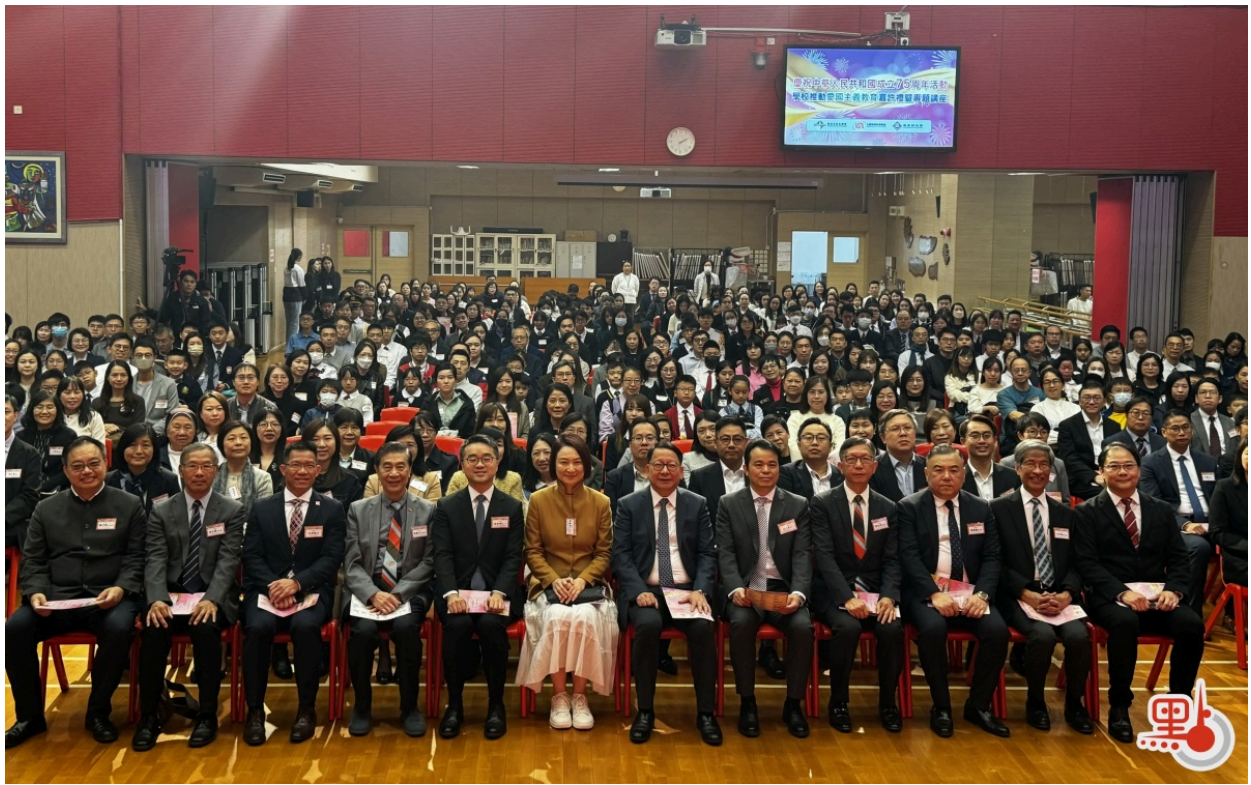
愛國主義教育嘉許禮暨專題講座今日舉行。

有與會者表示，嘉許禮不僅讓他們深切感受到愛國主義教育的重要性，也激發了他們繼續努力推動此項工作的信心和決心。此次活動的成功舉辦，不僅彰顯了香港教育界對愛國主義教育的重視，也為未來的教育方向指明了道路。