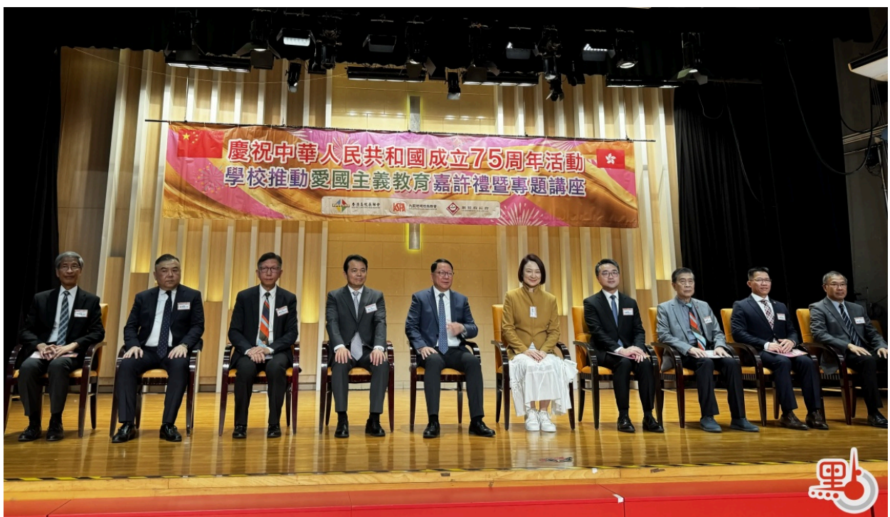
愛國主義教育嘉許禮暨專題講座今日舉行。